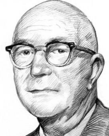
גורדון אלפורט 1897- 1967