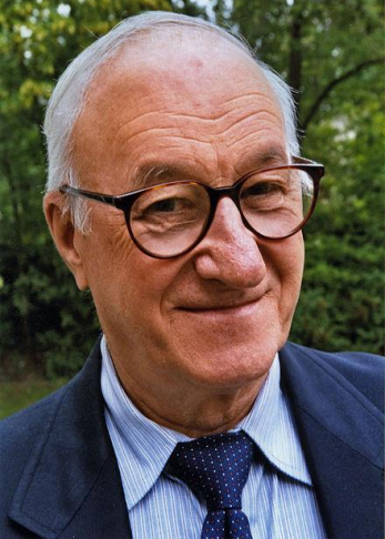
אלברט בנדורה -1925