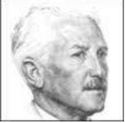
אריק אריקסון 1901-1994