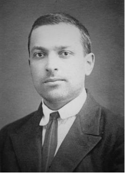
לב ויגוצקי 1896-1934