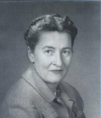
מרי איינסוורת 1913-1999