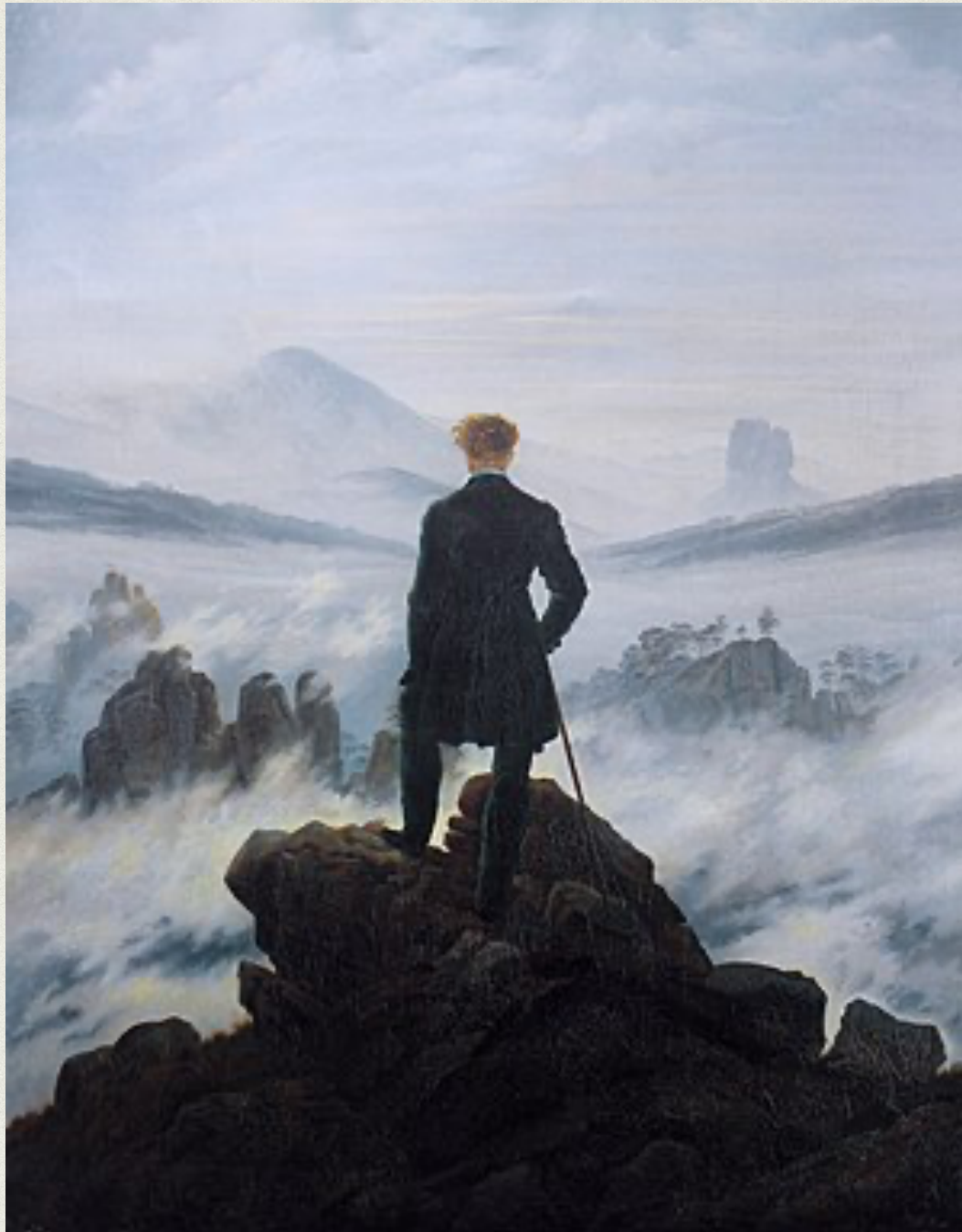
Caspar David Friedrich, Wanderer above the Sea of Fog, 1818